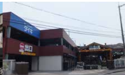
ホームセンターダイキ《徒歩5分》