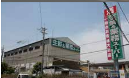
業務スーパー《徒歩6分》