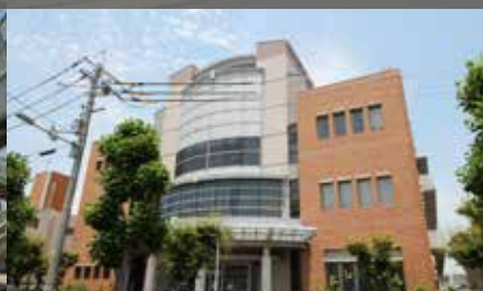
高川図書館《徒歩8分》