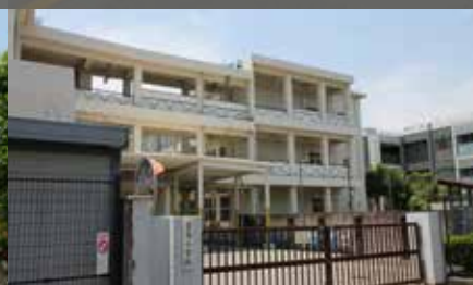
豊南小学校《徒歩8分》