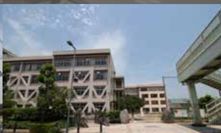
高川小学校《徒歩8分》