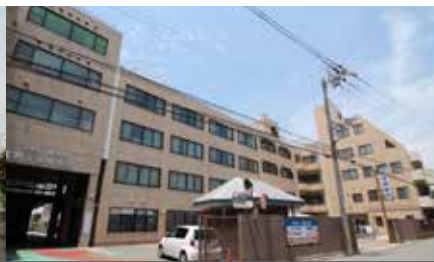
小曽根病院《徒歩5分》